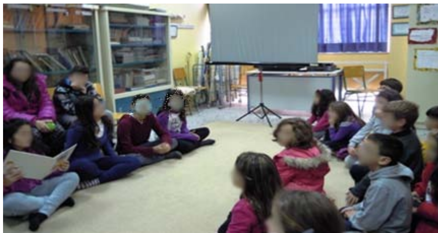
Διαβάζοντας παραμύθια στη Βιβλιοθήκη του Σχολείου