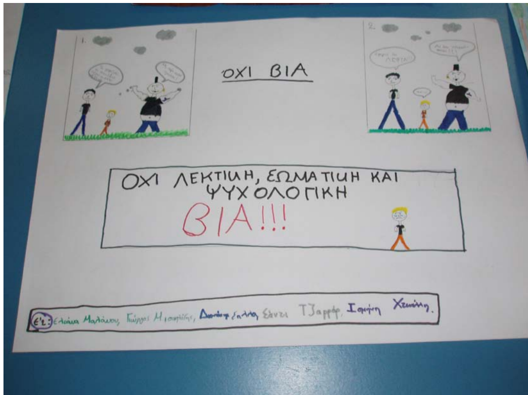
Γιατί η βία.....δεν είναι μόνο μία....