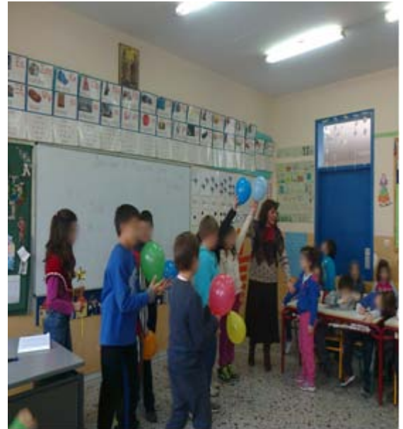
.....τα μπαλόνια παρουσιάζονται