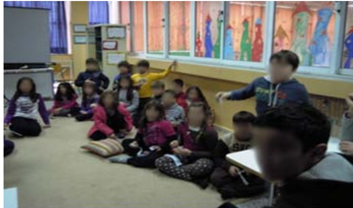
Το παιχνίδι ....τόρα ξεκινά