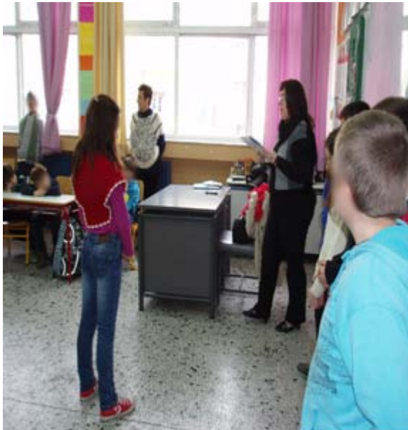
Η αφήγηση μόλις ξεκινά.....