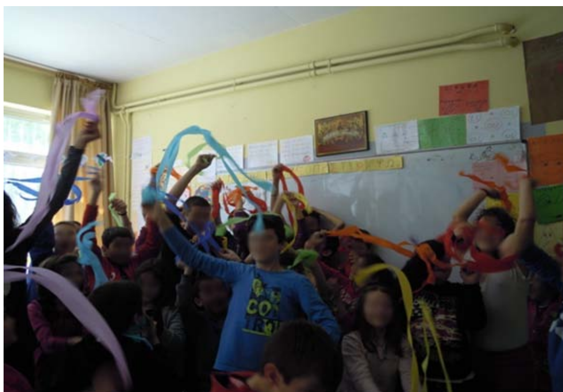
Πόσο καλά περάσαμε....μικροί και μεγάλοι